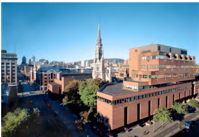
L'UQAM de jour

Ayant déjà réservé l'infrastructure d'accueil du congrès de l'AIFRIS auprès de l'Université du Québec à Montréal (UQAM), les membres du comité organisateur sont particulièrement sensibles aux divers contextes de restriction budgétaire qui pourraient influencer la décision des collègues européens de traverser l'Atlantique.