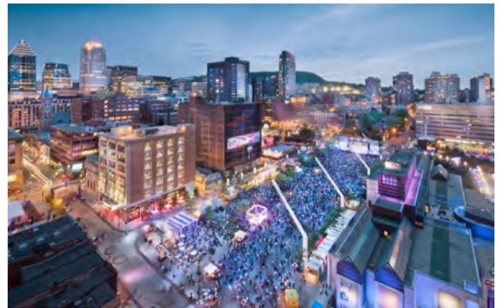
La place des festivals - Quartier des spectacles - Montréal

Vous pouvez aussi avoir une idée de ce qu'offre la Ville de Montréal en période estivale en visitant le site suivant : http://www.tourismemontreal.org/Accueil .