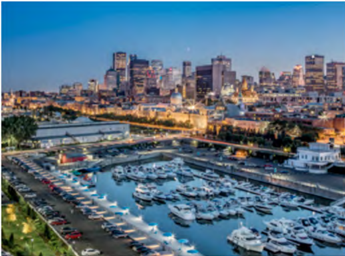
Vue sur le vieux port

Le comité organisateur prévoit aussi d'organiser la traditionnelle soirée festive, le 6 juillet, au Vieux-Port de Montréal, dans un décor époustouflant au bord du fleuve St-Laurent avec vue panoramique sur le centre-ville de Montréal. Nous ferons affaire avec un traiteur venant du milieu communautaire ainsi qu'une animation culturelle faisant écho au thème des solidarités sociales.