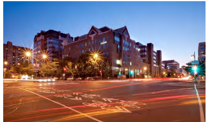
L'UQAM de nuit

En plus de cette offre particulière d'hébergement, il existe un certain nombre d'hôtels et de gîtes du passant (ou Bed & Breakfast) à proximité de l'UQAM (tarifs entre 110$ (83€) et 200$ (138€)) et dont les coordonnées seront affichées prochainement sur le site de l'AIFRIS. Nous explorons aussi les possibilités offertes par une agence de voyages pour obtenir les meilleurs tarifs des vols aériens à destination de Montréal.